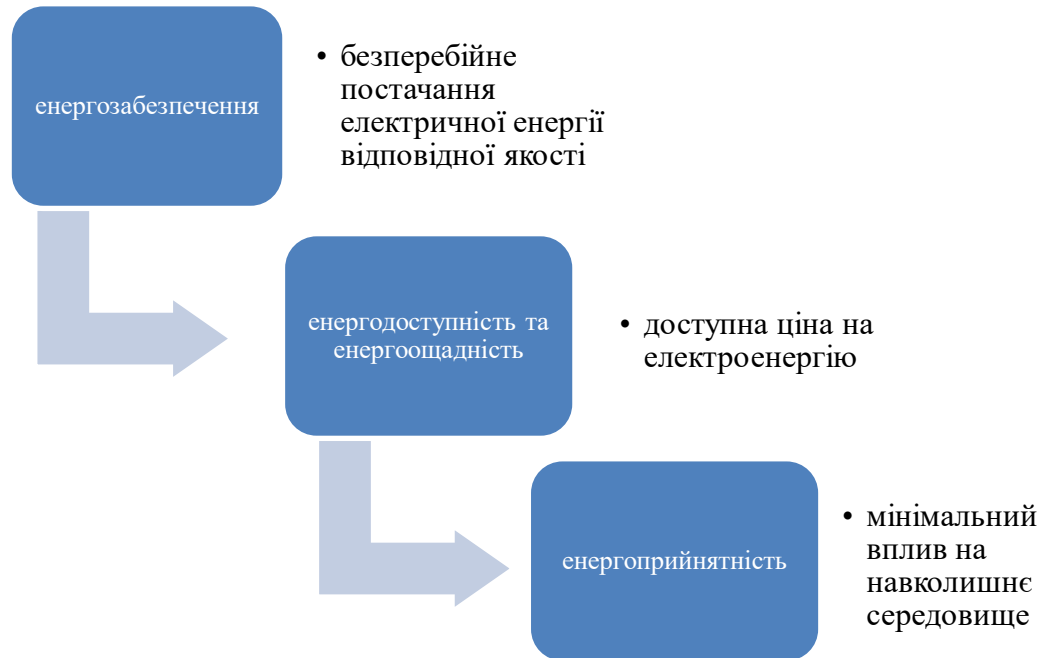
Рис. 1. Складові концепції (побудовано на підставі [1])

нерозривності та взаємоузгодженості усіх дій при поєднанні трьох складових (рис. 1)