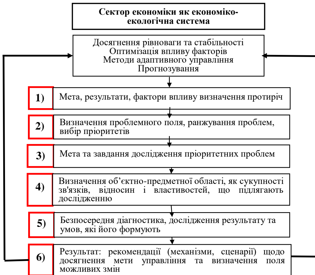
Рис. 1. Алгоритм діагностики економіко-екологічного управління в секторі національної економіки

Якщо галузевий аналіз спрямований на оцінку перспектив розвитку конкретної галузі господарства в контексті міжнародних викликів та національних тенденцій розвитку, то управлінська діагностика спрямована на встановлення, аналіз та оцінку проблем розвитку системи управління процесами, а також на виявлення головних напрямків підвищення ефективності управлінських рішень [1]. Алгоритм управлінської діагностики представлено на рис.1.